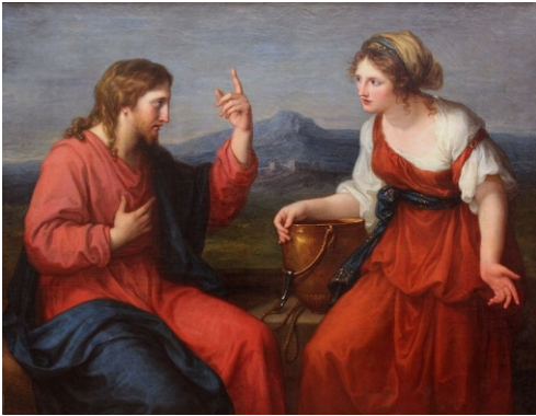
Angelica Kauffman (1741-1807)

Im Januar des zweiten Jahres verlässt Jesus mit seinen Jüngern die Gegend am Jordan, geht nach Samarien und macht Rast am Brunnen bei Sychar. Zwei Tage später zieht er weiter nach Galiläa ( Joh 4,43). In Kapernaum heilt er den todkranken Sohn eines königlichen Beamten.