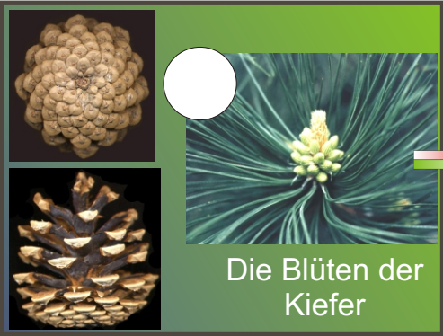
Die Blüten der Kiefer