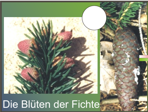
Die Blüten der Fichte