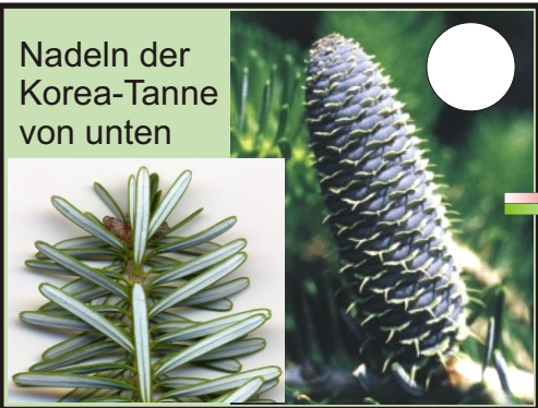
Nadeln der Korea-Tanne von unten