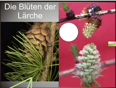
Die Blüten der Lärche